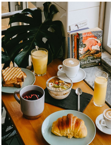
FOTOGRAFIA nr 1

Co jest na stole po lewej stronie, a czego nie ma na stole po prawej stronie?